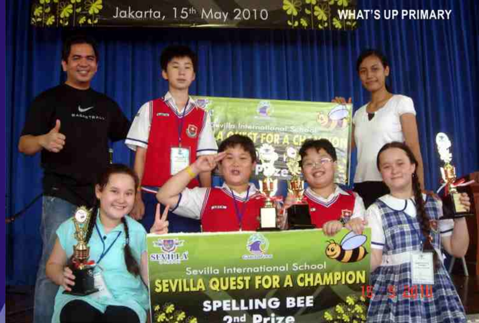
TRAINED TO WIN!! SMIS students and teachers could not hide their jubilation minutes after capturing major awards in what had turned out to be a classic virtual two-school championship duel that will surely go down in the annals of the event's history.