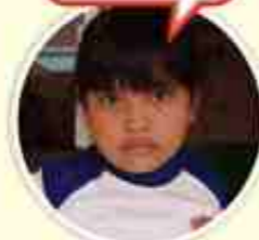
Angel (TK B 3)