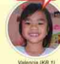
Valencia (KB 1)

"Mau jadi Dokter anjing soalnya di rumah aku punya anjing..."