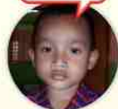
Danang (TK A)