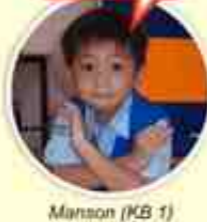
Manson (KB 1)