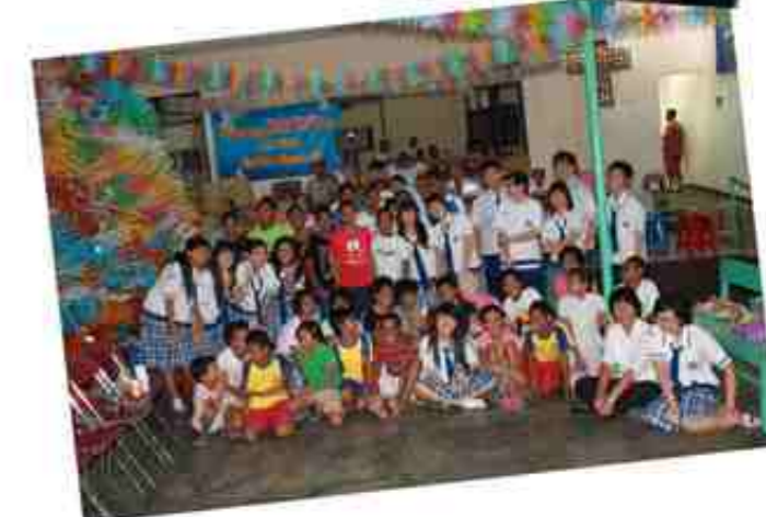
Oleh : Brigitta Camellia Tan